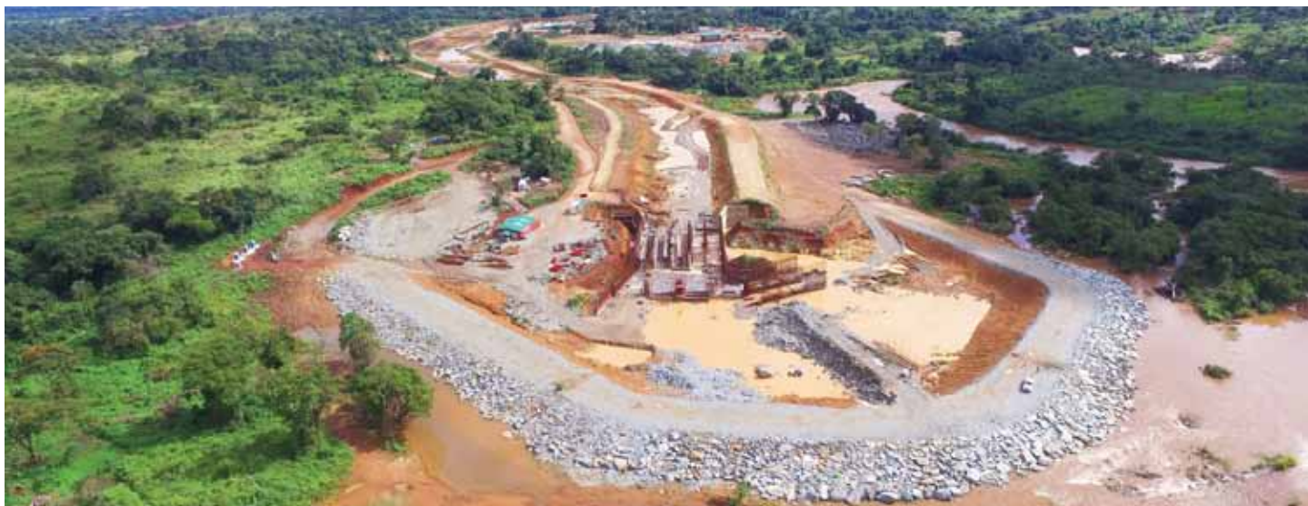
Vue du système d'admission. La construction de la troisième nouvelle centrale hydroélectrique de Kibali, Azambi, gérée par l'équipe contractuelle congolaise progresse bien.

« La RDC dispose de tous les atouts nécessaires pour construire une industrie minière durable, mais cela nécessitera d'établir un partenariat résolument engagé entre le gouvernement, d'une part, et les sociétés minières, d'autre part. En dépit de récentes indications contradictoires, nous restons convaincus qu'un tel partenariat est à portée de main et que le gouvernement comprendra qu'il est extrêmement important de maintenir un environnement fiscal et réglementaire stable et favorable aux investisseurs, pour le secteur minier du pays. A cet effet, nous accueillerions favorablement l'opportunité de travailler avec le gouvernement et conjointement sélectionner un groupe d'experts indépendants pour référencer le code minier de la RDC ainsi que son cadre fiscal pour ensuite modéliser l'impact du projet du nouveau code, par rapport au quel nous restons convaincu qu'il endommagerait le développement de l'industrie. »